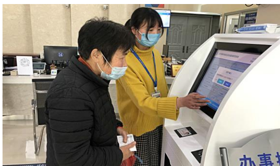
工作人员帮助老年人智能取号（资料）

政府工作报告指出，不能让智能工具给老年人的日常生活造成障碍。常州在政务服务方面推出了一些暖心小举措，方便老人用手机办理业务、扫码支付等，让老年人告别办事难。