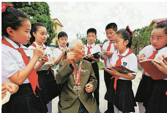
暑期，徐州市民主路小学开展“童心向党追梦成长”主题活动。图为该校少先队员日前来到江苏省军区徐州第一离职干部休养所，寻访革命前辈事迹。