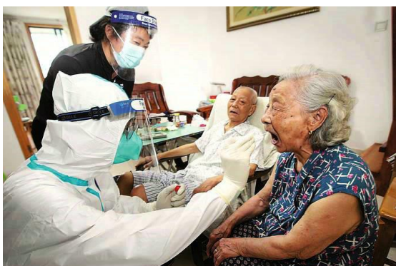
7月25日，南京定坊社区为辖区的老人以及行动不便的居民开辟绿色通道，上门为她们进行核酸采样。