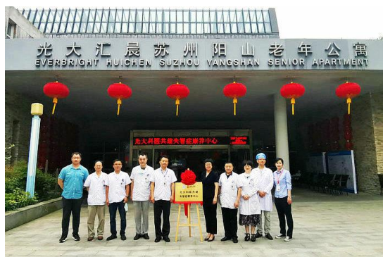
6月30日，苏州科技城医院与光大养老共建失智症康养中心揭牌。将为苏州市老年失智症患者提供更优质、高效、全周期的医疗服务，探索老年失智症防治新模式。（澎湃）