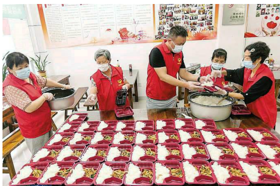
7月26日，如皋市如城街道，绿叶义工志愿服务队“公益助餐”的志愿者正在为独居老人准备爱心午餐。“公益助餐”计划是志愿服务队推出的一项公益活动，自2018年创办以来，志愿者每周一至周五免费为如城街道行动不便的50位老人提供送餐等服务。