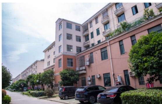
（东进花园框架砖混的平层入户电梯）

案、集资方案。除了在速度上变快，靖江还打破部门壁垒，将加装电梯与老旧小区改造统筹实施、同步推进，努力做到“加梯统基准”“综合改一次”。目前已在景馨花园、人大公寓等多个旧改项目中实施推进。