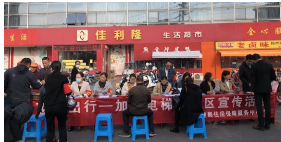
（加装电梯政策宣传走进社区）

给予每台12万元补贴。在电梯施工完成后，使用主体凭既有住宅增设电梯联合会审表、电梯使用证、增设电梯竣工验收报告、财政补贴资金分配方案等资料至各属地申请。